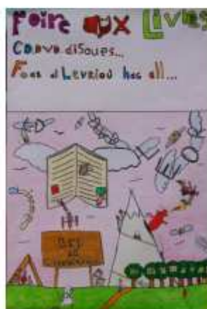
Affiche / Skritell gant : classe CM 2014-2015 Diwan Lesneven