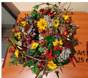
Art Floral du 25 novembre

KELEIER TRELEZ NOUVELLES DE TRELEZ 9 décembre 2021 N° 2003