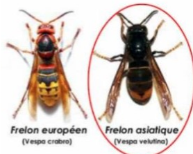
Frelon européen (Vespa crabro)